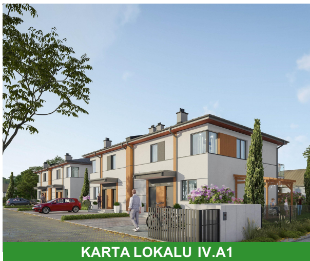
KARTA LOKALU IV.A1